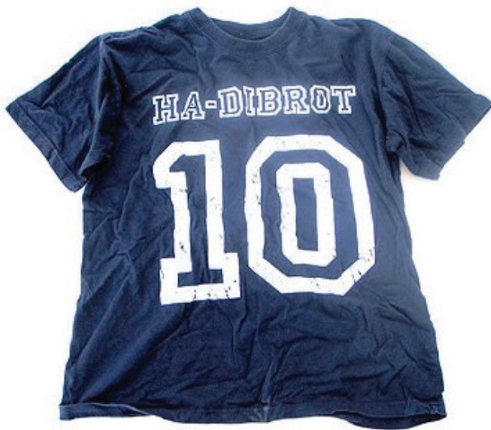
שם האומן : אריק וייס

(פרופ' דן אריאלי, עשרת הדיברות כתזכורת לקוד אתי, אתר ליבא)