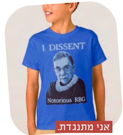
אני מתנגדת. R.B.G. המורדת

מתוך: 'הסיבה האמיתית לכך שרות ביידר גינסבורג כונתה 'R.B.G' הידועה לשמצה'. (ג'ניפר ליאונרד, The List, 18.9.2020)