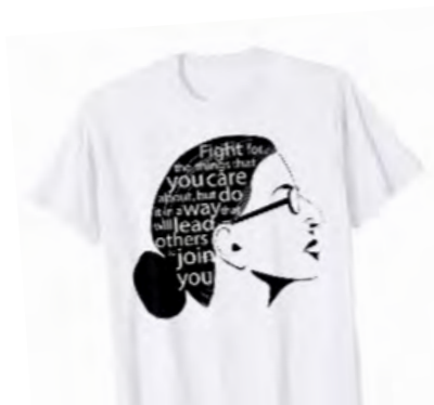
לחמו על הדברים שאכפת לכם מהם, אך עשו זאת באופן שיוביל אחרים להצטרף אליכם/ן