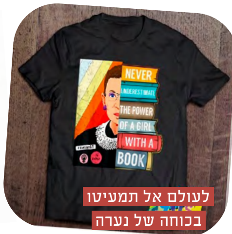
לעולם אל תמעיתו בכוחה של נערה עם ספר