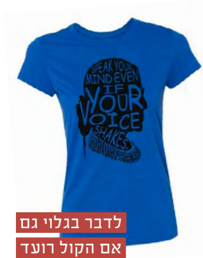
לדבר בגלוי גם אם הקול רועד