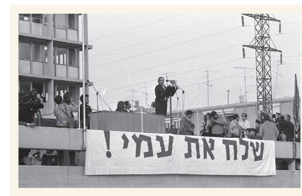
גולדה מאיר בהפגנה למען אסירי ציון

עוד לא אֶבְדָּה תְּקוּנָתָהּ, הַתְּקוּהָ בְּת שָׁנוֹת אֲלֵפִים, לְהִיּוֹת עִם חֶפְשִׁי בְּאַרְצָנוּ, אֶרֶץ צִיּוֹן וִירוּשָׁלַיִם.