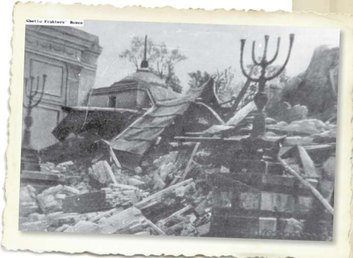
ארכיון לוחמי הגטאות