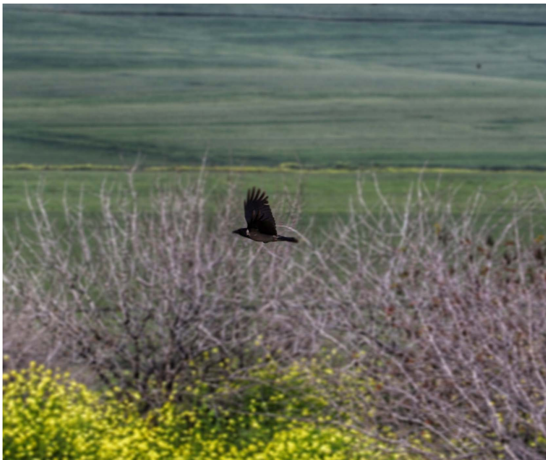
קרדיט: איתן אלחזז ברק