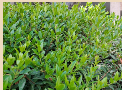
באדיבות אביאל ענבי