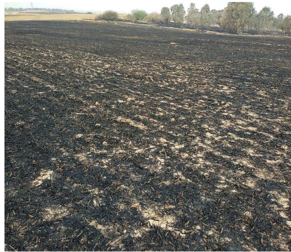
בעשור האחרון בלוני תבערה שנשלחו מגבול עזה הבעירו את שדות גידולי השדה בקיבוצים ובמושבים הקרובים לגבול וכילו את התוצרת החקלאית.