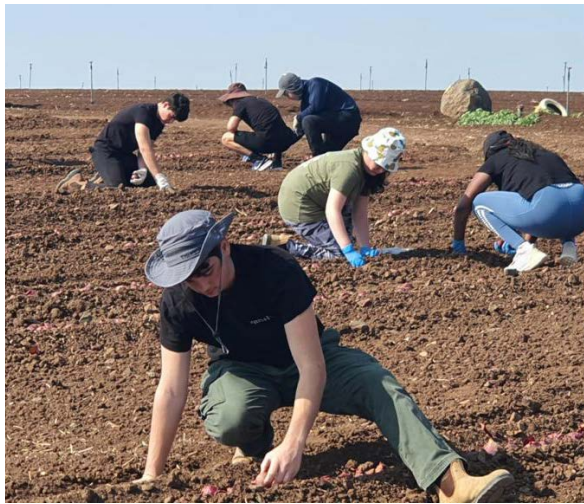
תלמידי.ות תיכון "עמקים תבור" מקיבוץ מזרע מתנדבים בחקלאות.