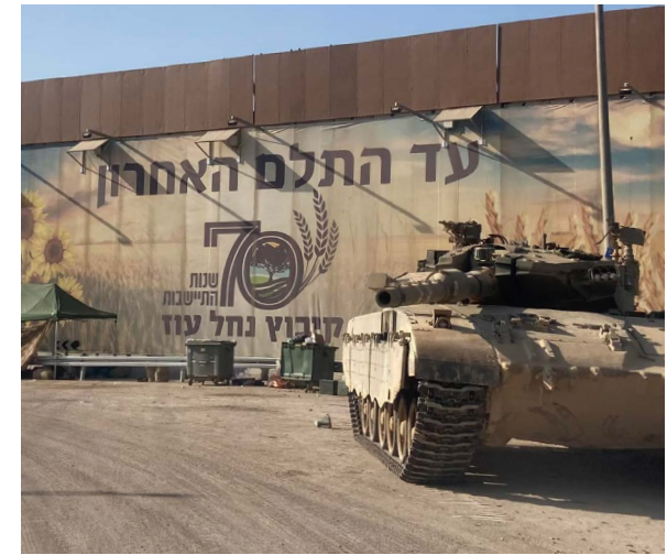
השלט "עד התלם האחרון" (ציטוט מדברי טרומפלדור), נתלה לקראת חגיגות ה-70 לקיבוץ נחל עוז. התמונה צולמה במהלך המלחמה.